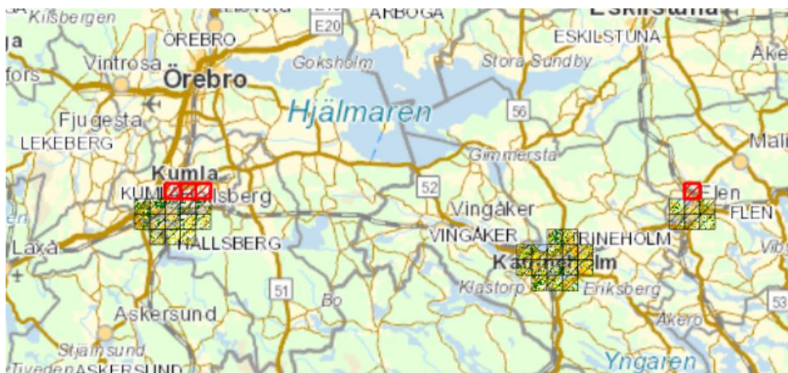
Figur 2. Viss del av tätorterna Kumla och Flen saknas. Saknade indexrutor skrafferade i rött. Bakgrundskarta: Metria Maps.